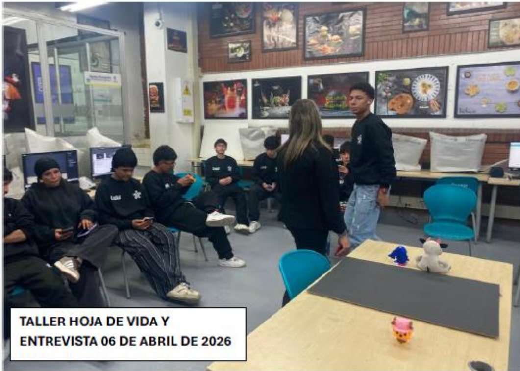
TALLER HOJA DE VIDA Y ENTREVISTA 06 DE ABRIL DE 2026