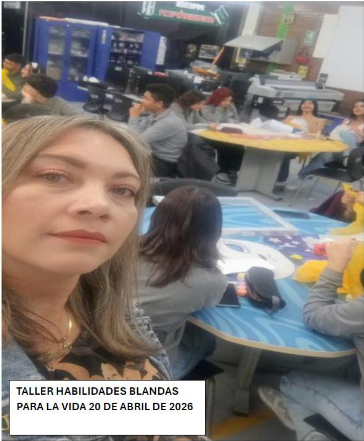
TALLER HABILIDADES BLANDAS PARA LA VIDA 20 DE ABRIL DE 2026