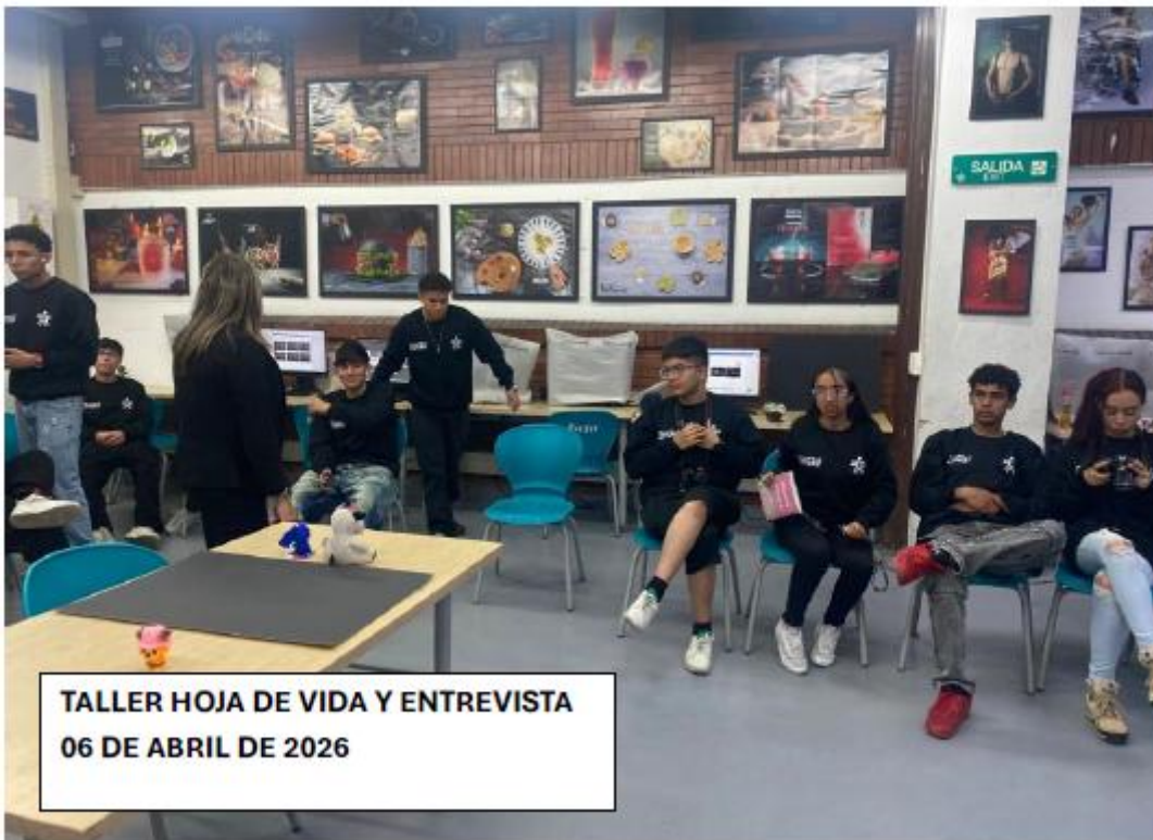
TALLER HOJA DE VIDA Y ENTREVISTA 06 DE ABRIL DE 2026